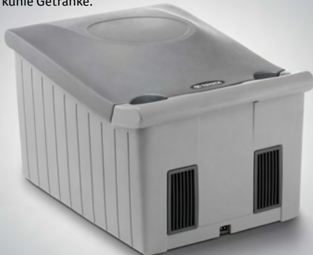
Kühl-/Heizbox (27) Für warme Speisen und kühle Getränke.