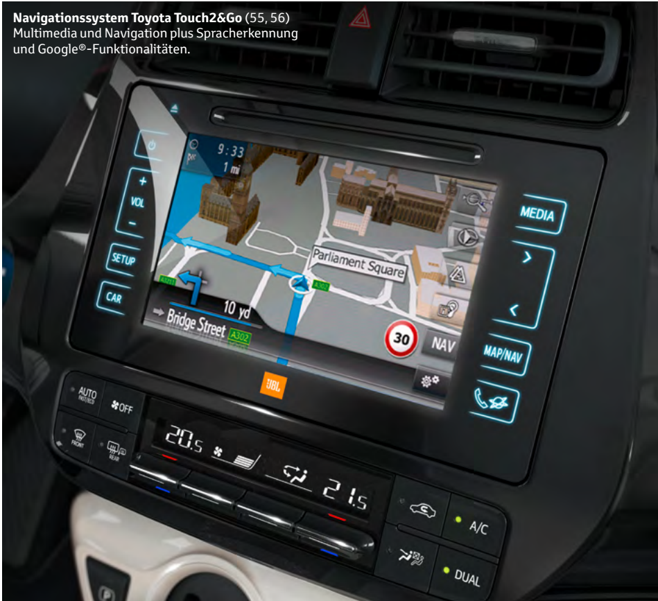
Navigationssystem Toyota Touch2&Go (55, 56) Multimedia und Navigation plus Spracherkennung und Google®-Funktionalitäten.

Immer perfekt ans Ziel und immer gut unterhalten: Mit dem Kommunikations- und Navigationszubehör für Ihren Prius.