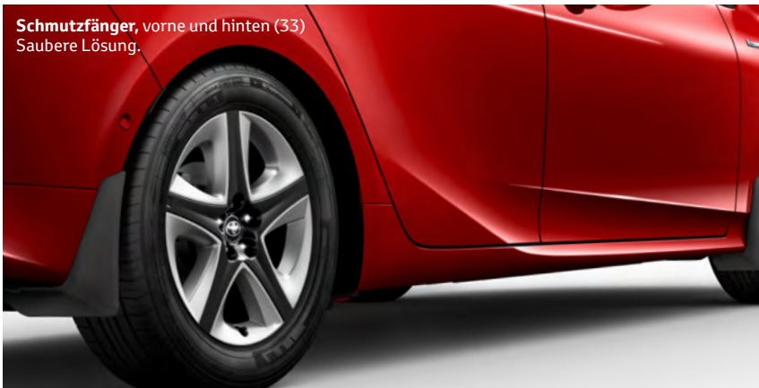
Schmutzfänger , vorne und hinten (33) Saubere Lösung.