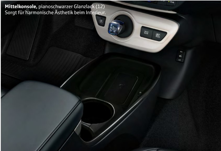
Mittelkonsole, pianoschwarzer Glanzlack (12) Sorgt für harmonische Ästhetik beim Interieur.