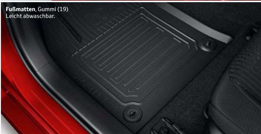
Fußmatten , Gummi (19) Leicht abwaschbar.