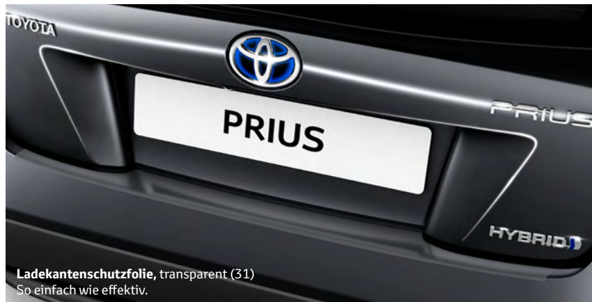
Ladekantenschutzfolie, transparent (31) So einfach wie effektiv.