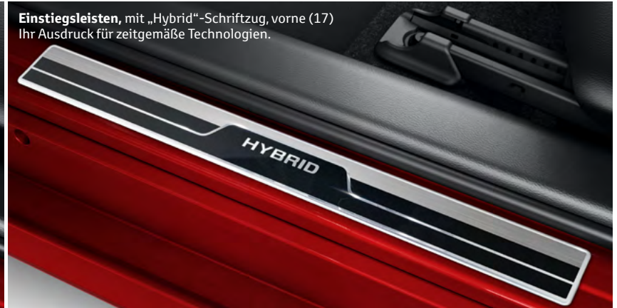
Einstiegsleisten , mit „Hybrid“-Schriftzug, vorne (17) Ihr Ausdruck für zeitgemäße Technologien.