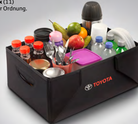
Aufbewahrungs-Box (11) Einfach alles in bester Ordnung.