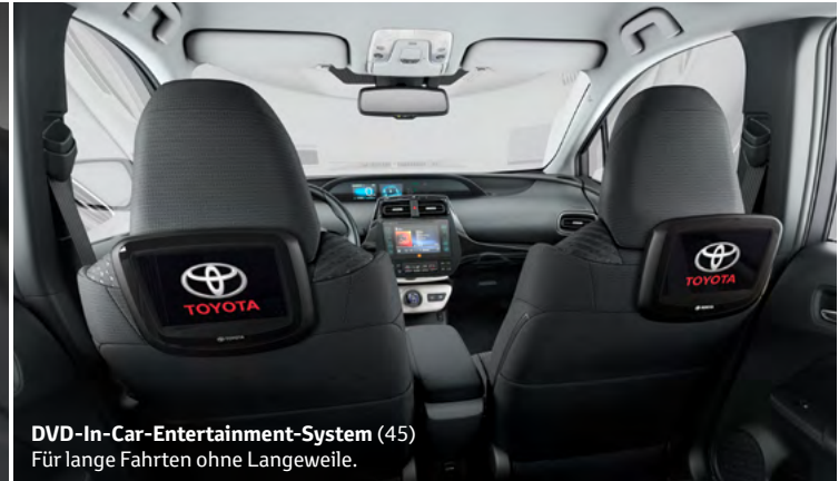
DVD-In-Car-Entertainment-System (45) Für lange Fahrten ohne Langeweile.