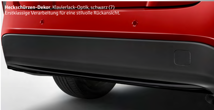
Heckschürzen-Dekor , Klavierlack-Optik, schwarz (7) Erstklassige Verarbeitung für eine stilvolle Rückansicht.