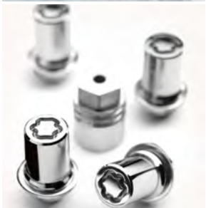
Felgenschlösser (5) Gibt Dieben keine Chance.