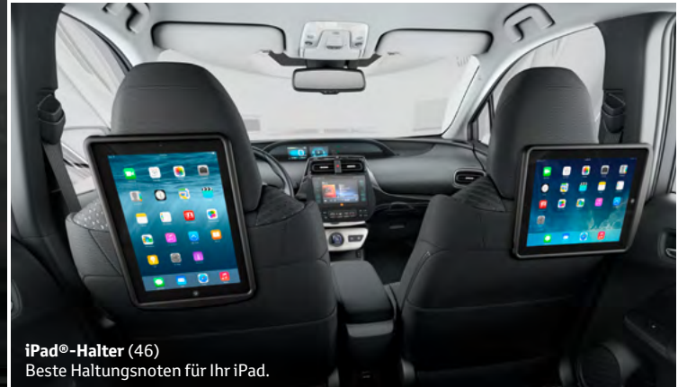
iPad®-Halter (46) Beste Haltungsnoten für Ihr iPad.