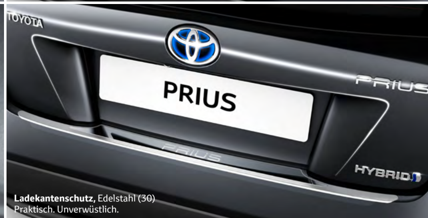
Ladekantenschutz, Edelstahl (30) Praktisch. Unverwüstlich.