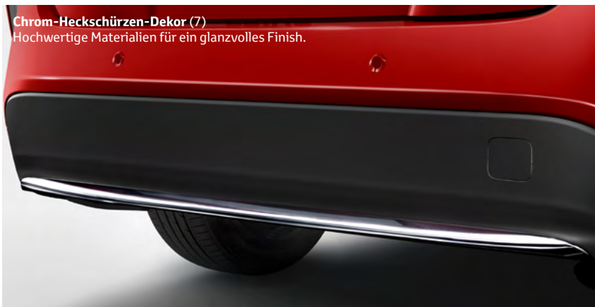
Chrom-Heckschürzen-Dekor (7) Hochwertige Materialien für ein glanzvolles Finish.