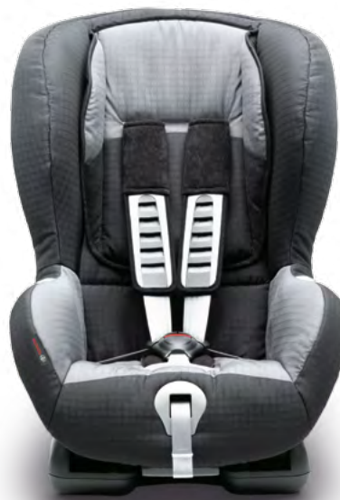
Kindersitz G1, ISOFIX (24) Mit einem Handgriff sitzbereit.