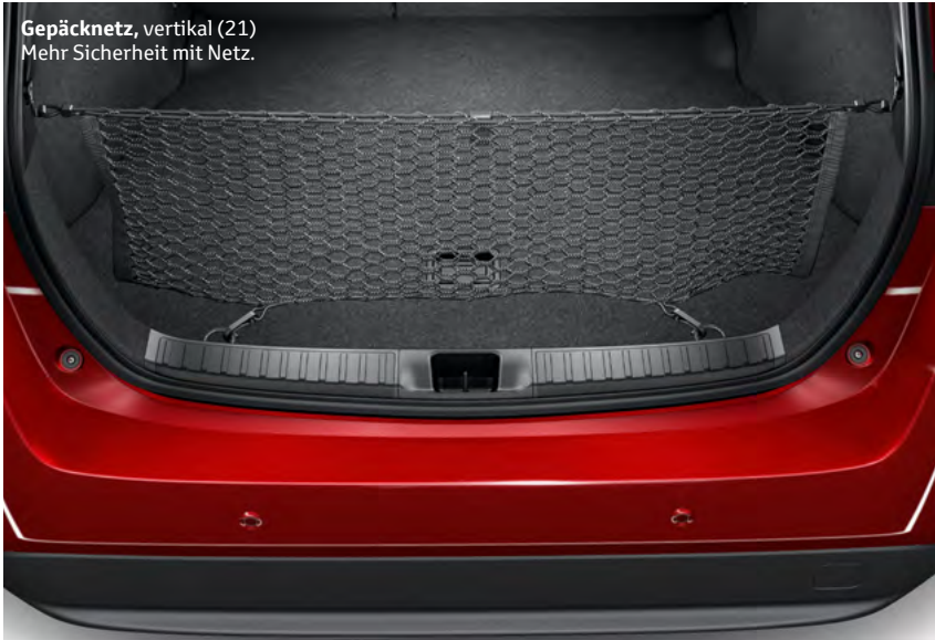
Gepäcknetz, vertikal (21) Mehr Sicherheit mit Netz.