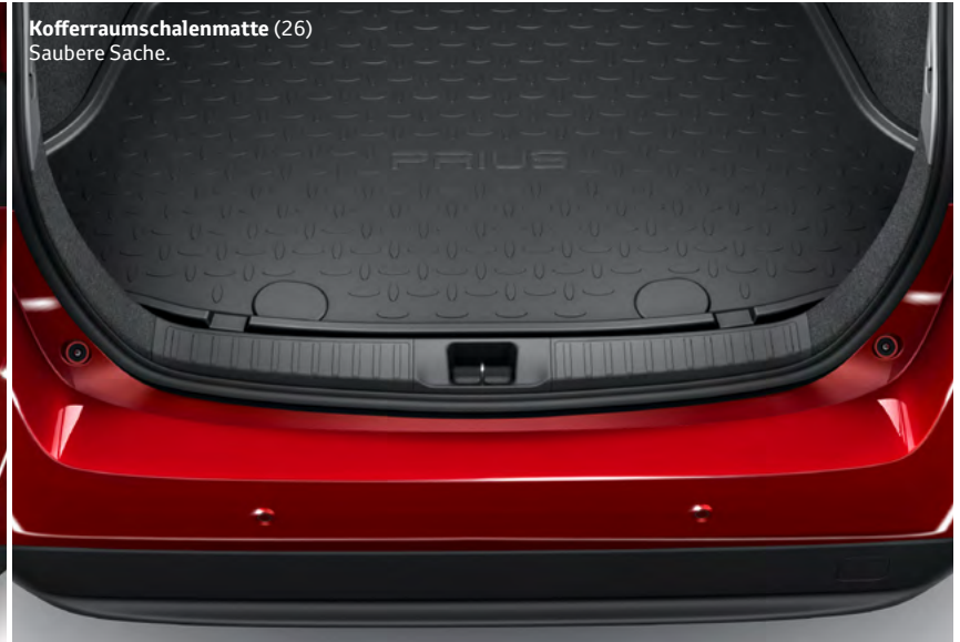
Kofferraumschalenmatte (26) Saubere Sache.