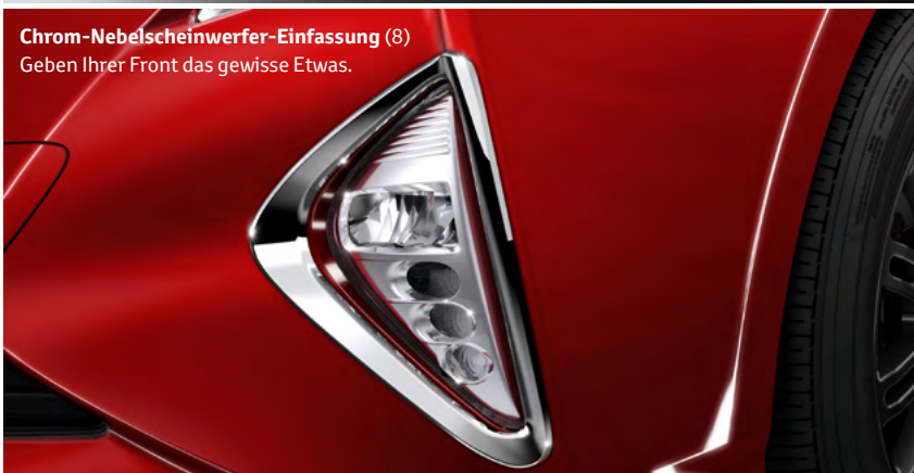
Chrom-Nebelscheinwerfer-Einfassung (8) Geben Ihrer Front das gewisse Etwas.