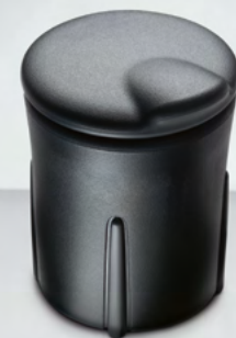
Aschenbecher (10) Verschlussdichte Abdeckung lässt keine Gerüche frei.