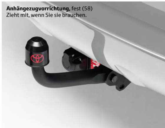
Anhängezugvorrichtung, fest (58) Zieht mit, wenn Sie sie brauchen.