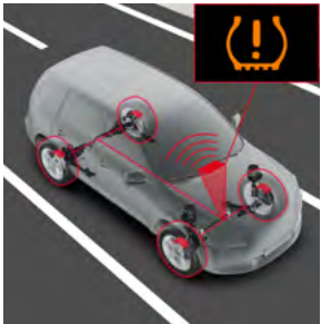
Reifendruck-Warnsystem (3) Immer alles unter Kontrolle.