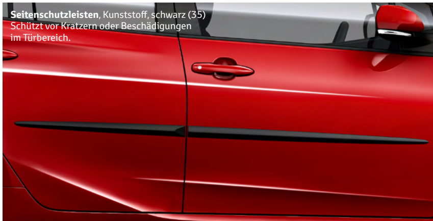
Seitenschutzleisten , Kunststoff, schwarz (35) Schützt vor Kratzern oder Beschädigungen im Türbereich.