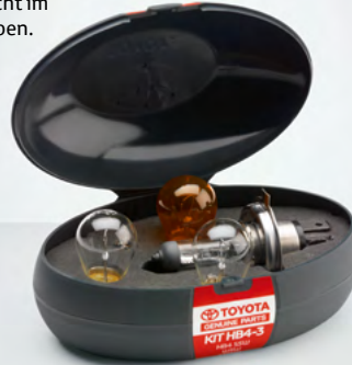
Ersatzbirnen-Set (74) Damit Sie nicht im Dunkeln tappen.