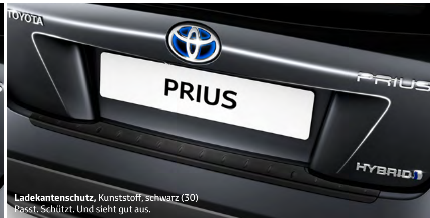
Ladekantenschutz, Kunststoff, schwarz (30) Passt. Schützt. Und sieht gut aus.