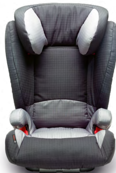
Kindersitz G2 (25) Für kleine Prinzessinnen und echte Prinzen.