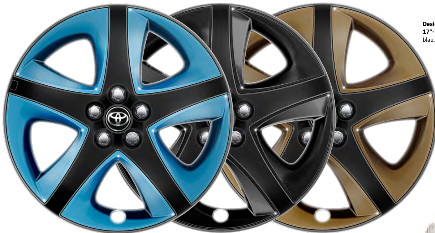
Design-Einsätze für serienmäßige 17"-Leichtmetallfelgen, schwarz, blau, bronze (2)