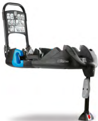
Basisstation für Kindersitz G0 (23) Zusätzliche Schutzwirkung und Stabilität.

Mit Kindersitzen von Toyota überlassen Sie nichts dem Zufall. Dank der idealen Verbindung von Sicherheit und hohem Sitzkomfort werden auch lange Reisen für kleine Passagiere zum unbeschwerten Vergnügen.