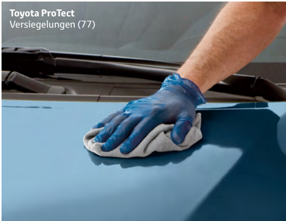
Toyota ProTect Versiegelungen (77)