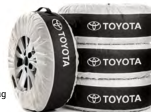
Reifentaschen (4) mit Toyota Schriftzug und Tragegriffen. Alles gut verpackt.