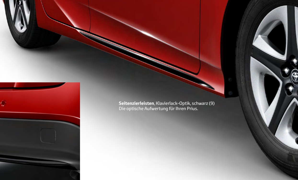
Seitenzierleisten , Klavierlack-Optik, schwarz (9) Die optische Aufwertung für Ihren Prius.