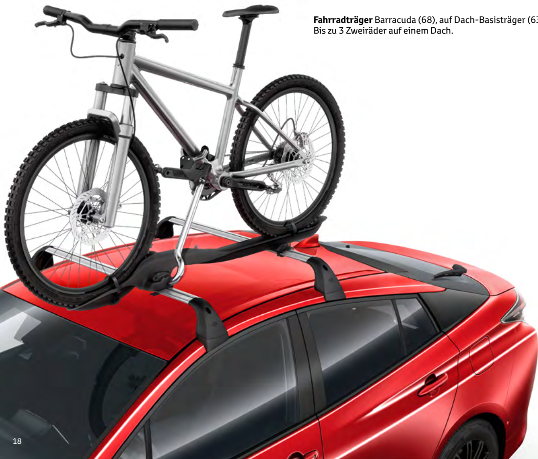
Fahrradträger Barracuda (68), auf Dach-Basisträger (63) Bis zu 3 Zweiräder auf einem Dach.