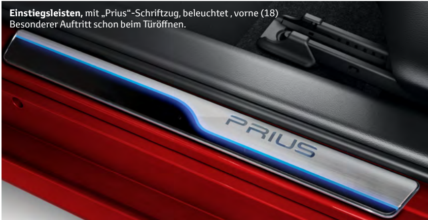
Einstiegsleisten , mit „Prius“-Schriftzug, beleuchtet, vorne (18) Besonderer Auftritt schon beim Türöffnen.