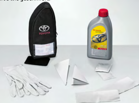
Motorölnachfüll-Set (74) So läuft's wie geschmiert.