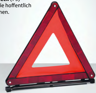
Warndreieck (79) Werden Sie hoffentlich nie brauchen.