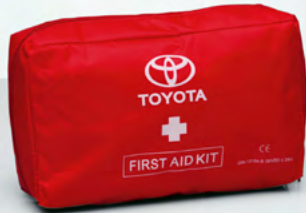
Verbandskissen (78) Gehört in jedes Auto.