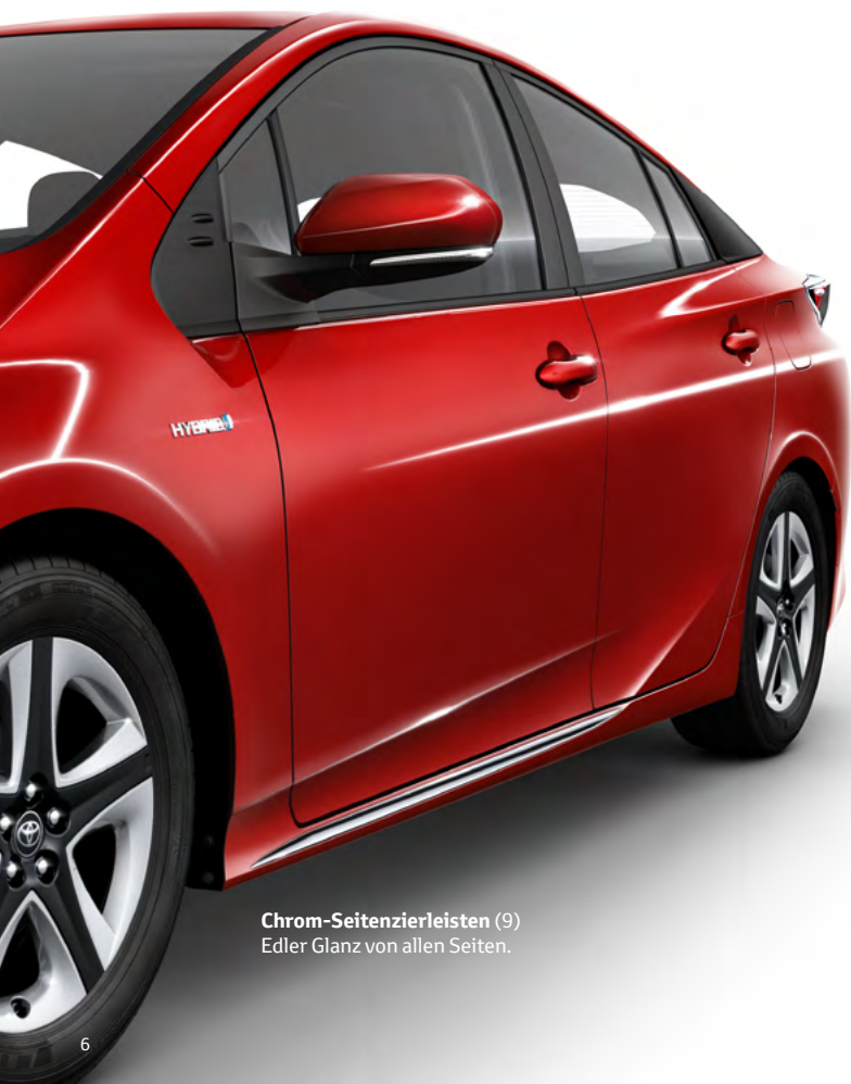
Chrom-Seitenzierleisten (9) Edler Glanz von allen Seiten.

Zeigen Sie Dynamik schon im Stand: Mit den passgenauen Sport- und Design-Hinguckern der Prius Kollektion.