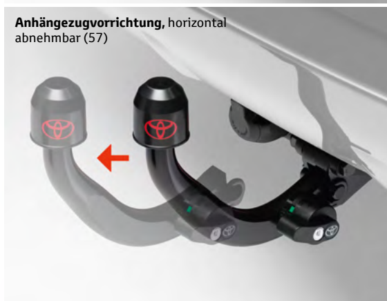
Anhängezugvorrichtung, horizontal abnehmbar (57)