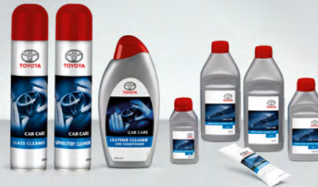
Fahrzeugpflege (74) Wer sein Auto liebt, der pflegt.