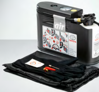
Reifenreparatur-Set (76) Bleiben Sie mobil.