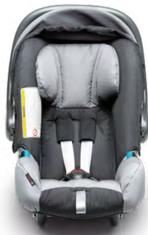
Kindersitz G0 (22) Auch die Kleinsten wollen mit.