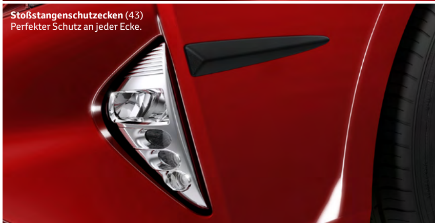
Stoßtangenschutzecken (43) Perfekter Schutz an jeder Ecke.