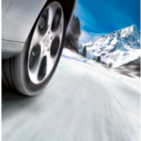
Winterkompletträder (6) Perfekte Haftung, auch bei extremen Temperaturen.

Gönnen Sie Ihrem Prius das besondere Etwas: denn die sportlichen Toyota Leichtmetallfelgen sind nicht nur besonders lauf ruhig, sondern auch ein echter Blickfang.