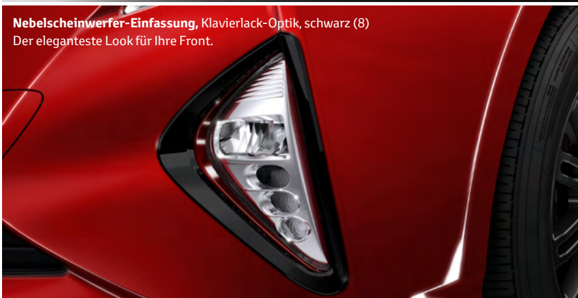
Nebelscheinwerfer-Einfassung , Klavierlack-Optik, schwarz (8) Der eleganteste Look für Ihre Front.