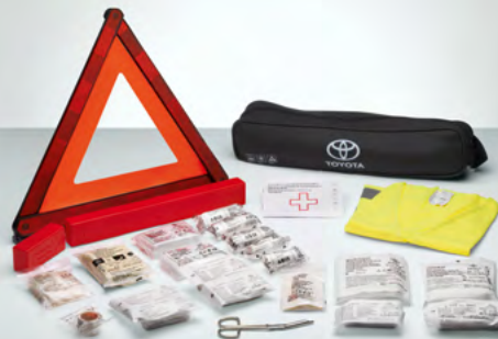
Pannentasche (75) Steckt jede Panne in die Tasche.