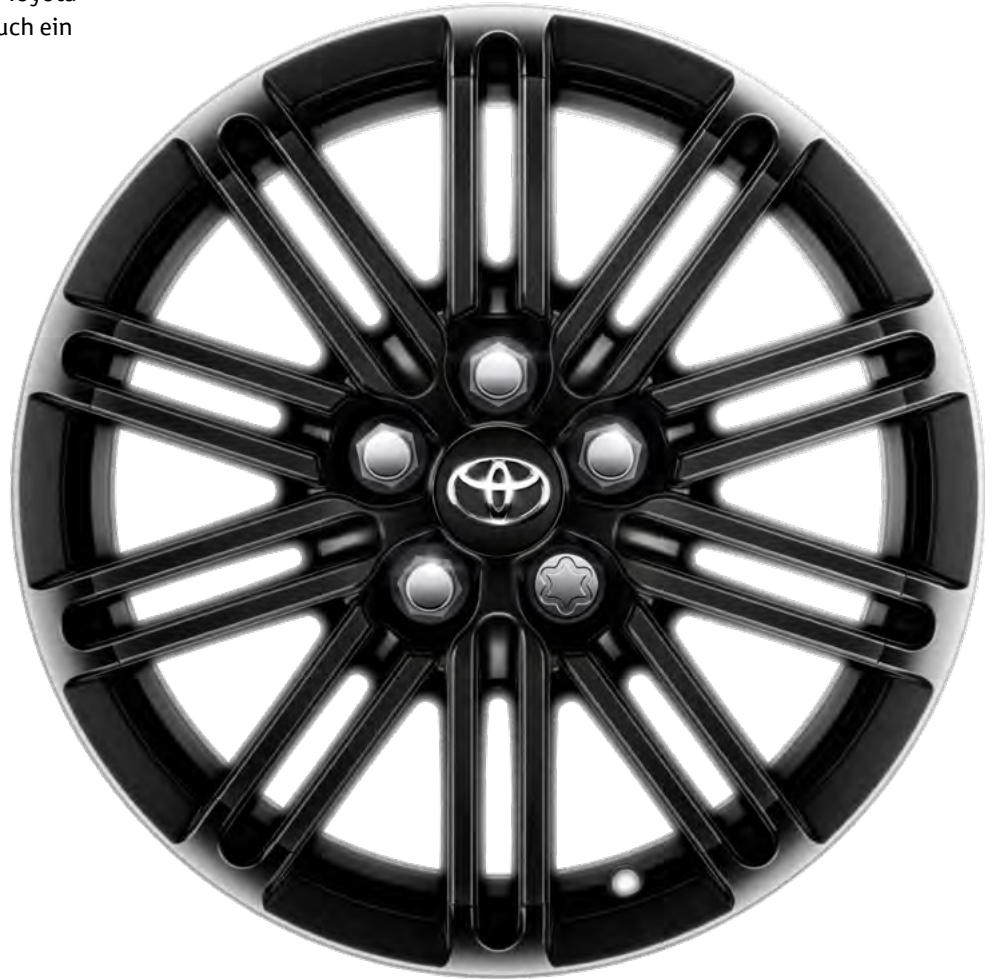
10-Doppelspeichen-Design, Leichtmetallfelge, hyper schwarz, 15" (1)