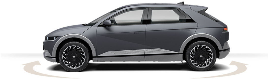
Abbildung ist als unverbindlich zu betrachten. Fahrzeugabbildungen enthalten z. T. aufpreispflichtige Sonderausstattungen.