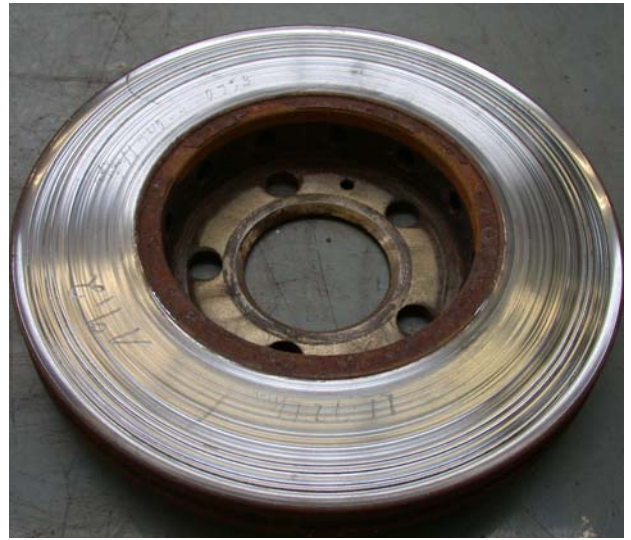
Bild2: Übersicht Bremsscheibe mit Riefen (VW)