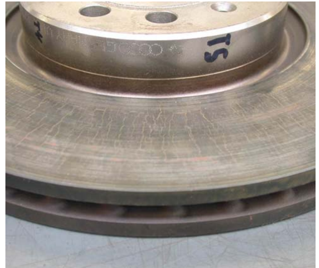
Bild 8: Bremsscheibe mit ausgeprägten, aber zulässigen Hitze-Haarrissen