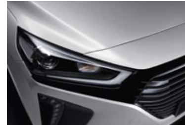
Platinum Silver Metallic