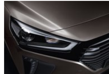
Demitasse Brown Mineraleffekt