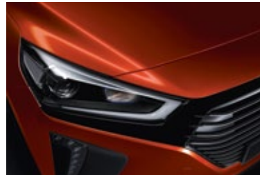
Phoenix Orange Mineraleffekt