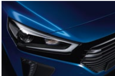
Marina Blue Metallic