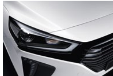
Polar White Uni