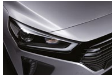
Aurora Silver Mineraleffekt