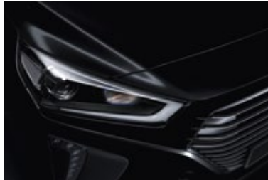
Phantom Black Mineraleffekt