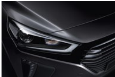
Iron Grey Mineraleffekt